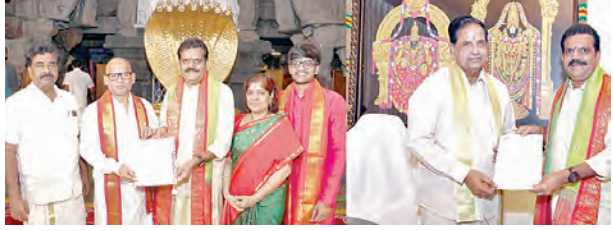
టిటిడికి విరాళాల వెల్లువ

తిరుమల, మే 29 ప్రభాతవార్త ప్రతినిధి: వేసవి సెలవులు ముగుస్తుండడం, వారాంతం రావడంతో తిరుమలలో భక్తుల రద్దీ వివరితంగా ఉంది. శుక్రవారం కూడా శిలాశోరణం వరకు సర్వస్థాయిలో కార్యక్రమాలు వ్యాపించాయి. ఉదయం 6 గంటల సమయానికి ఉదాత సర్వదర్శనం కోసం వచ్చిన భక్తులతో వైకుంఠం క్యూ కాంప్లెక్స్ కంప్లెక్స్లో అన్ని నిండిపోయి, క్యూలైన్లపై శిలాశోరణం వరకు కిలోమీటర్ల మేర విస్తరించాయి. ఉదయం 8 గంటల తర్వాత క్యూలైన్లలోకి ప్రవేశించిన భక్తులను శ్రీవారి సర్వదర్శనానికి దాదాపు 24 గంటల సమయం పడుతుంది. ఎన్ఐడీ దర్శనాలు ఆరుగంటలు సమయం పడుతుండగా బైమెన్జెట్ భక్తులకు పదిగంటలపైగానే నిరీక్షిస్తున్నారు. శుక్రవారం సాయంత్రం వరకు 49వేలమంది భక్తులు మహాలక్ష్మిలో స్వామివారిని దర్శించుకున్నారు.