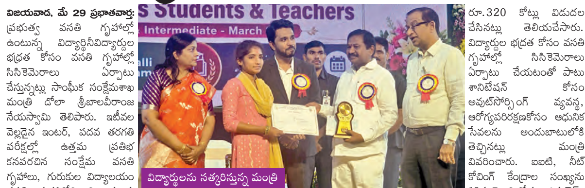
విద్యార్థులకు సత్కరిస్తున్న మంత్రి