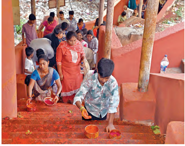
మెట్టపూజలు నిర్వహిస్తున్న భక్తులు