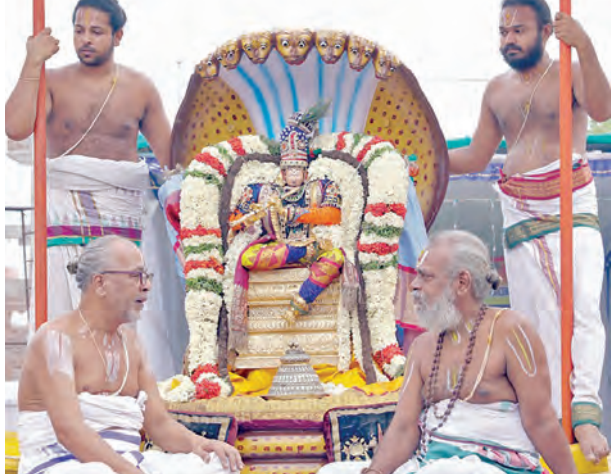
గోకులానందుడి రావంతో కల్యాణ వేంకటేశ్వరుడు