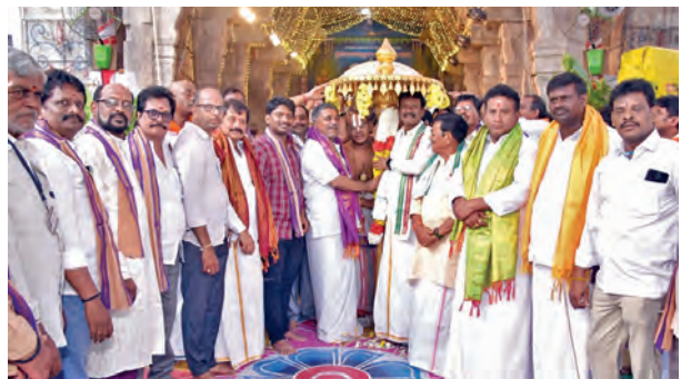
దివ్యరథంపై బంగారు గొడుగు